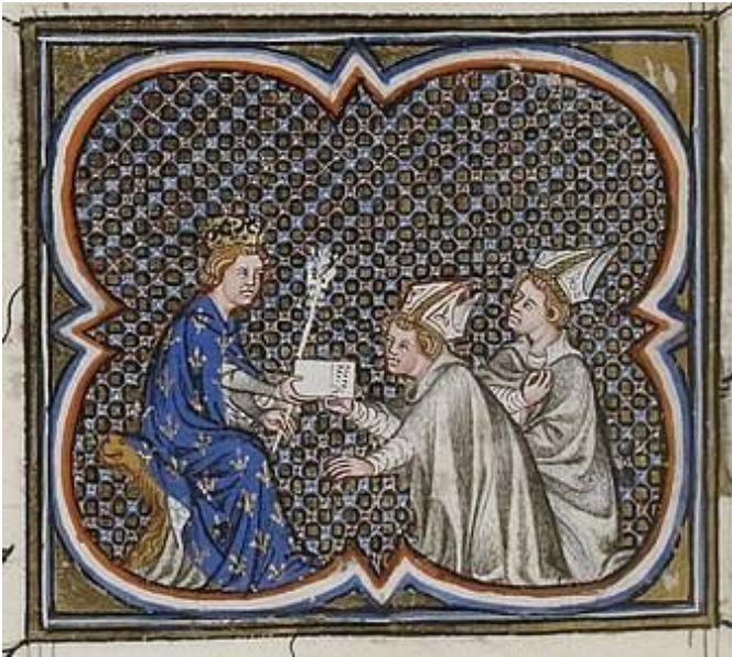
Philippe Auguste recevant des messagers du pape l'appelant à la croisade ( Grandes Chroniques de France de Charles V, XIV e siècle ).