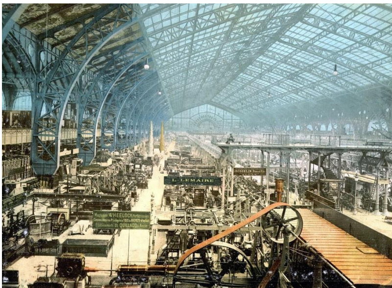
Hall d'exposition de l'exposition universelle de Paris, 1900