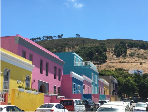
CapTown, Bo Kaap, 2023