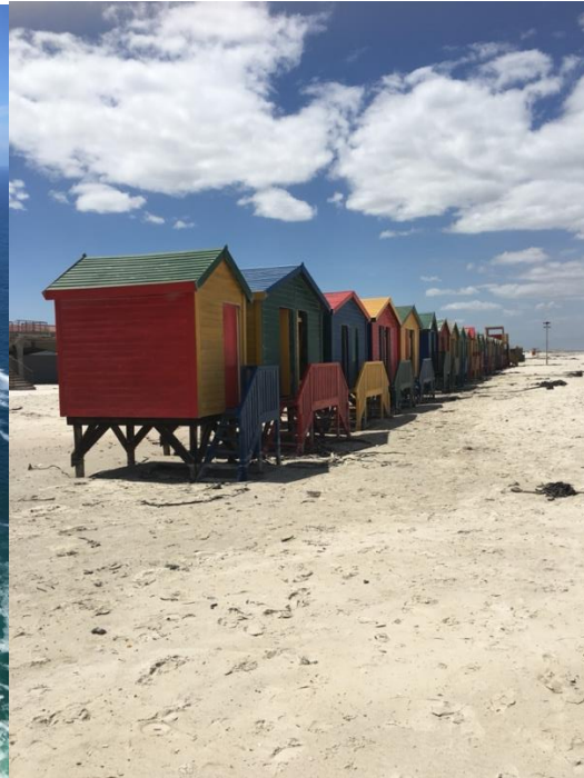
Muizenberg, 2023