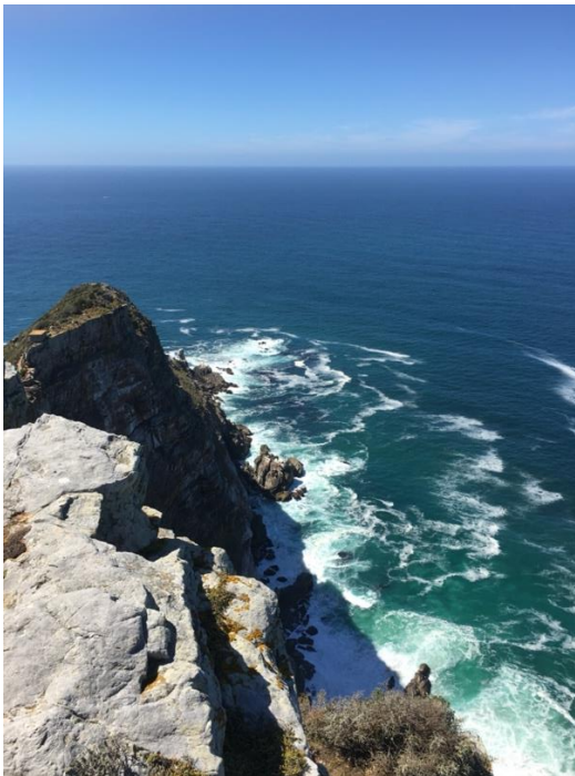
Cap de Bonne Espérance, 2023